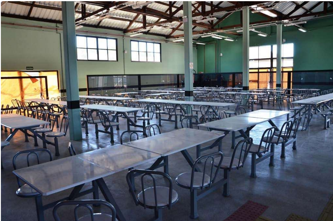
Figura 3: Restaurante Universitário