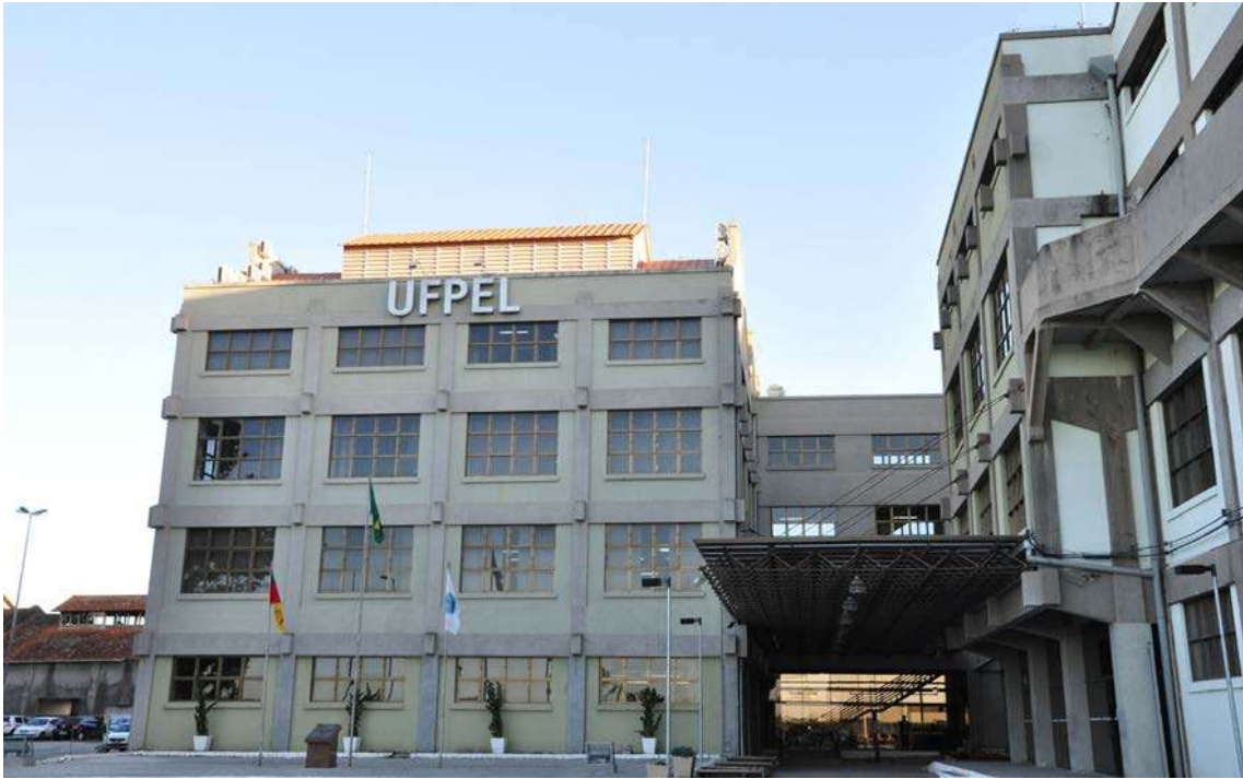
Figura 2: Prédios do campus Anglo